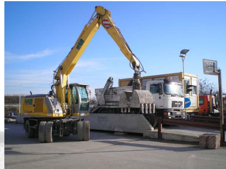
Mobilbagger New Holland MHPlus

Radmobile Prallmühle MFL 130/130 Maschinenfabrik Liezen