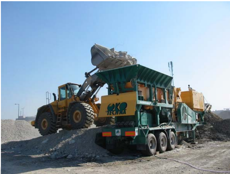
Radlader VOLVO L150E

Umsetzung 2006 : 2 Baumaschinen, 1 Brechanlage, 2 PKW